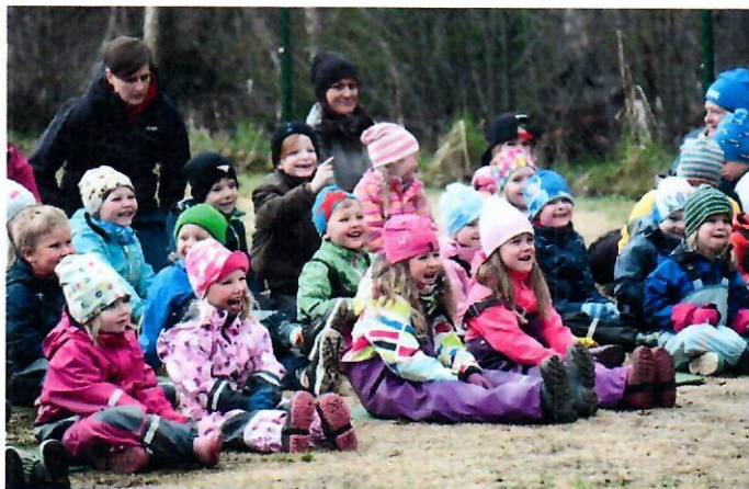
Pjäsen om Bobban drog ner en hel del skratt av barnen i Godby.