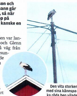
Den vita storken med sina kännspar och röda ben vilade i Södersunda i helgen.

Spaningen bekräftades när han googlade fågeln och täckningen. Det är första gången de sett en vit stork på riktigt.