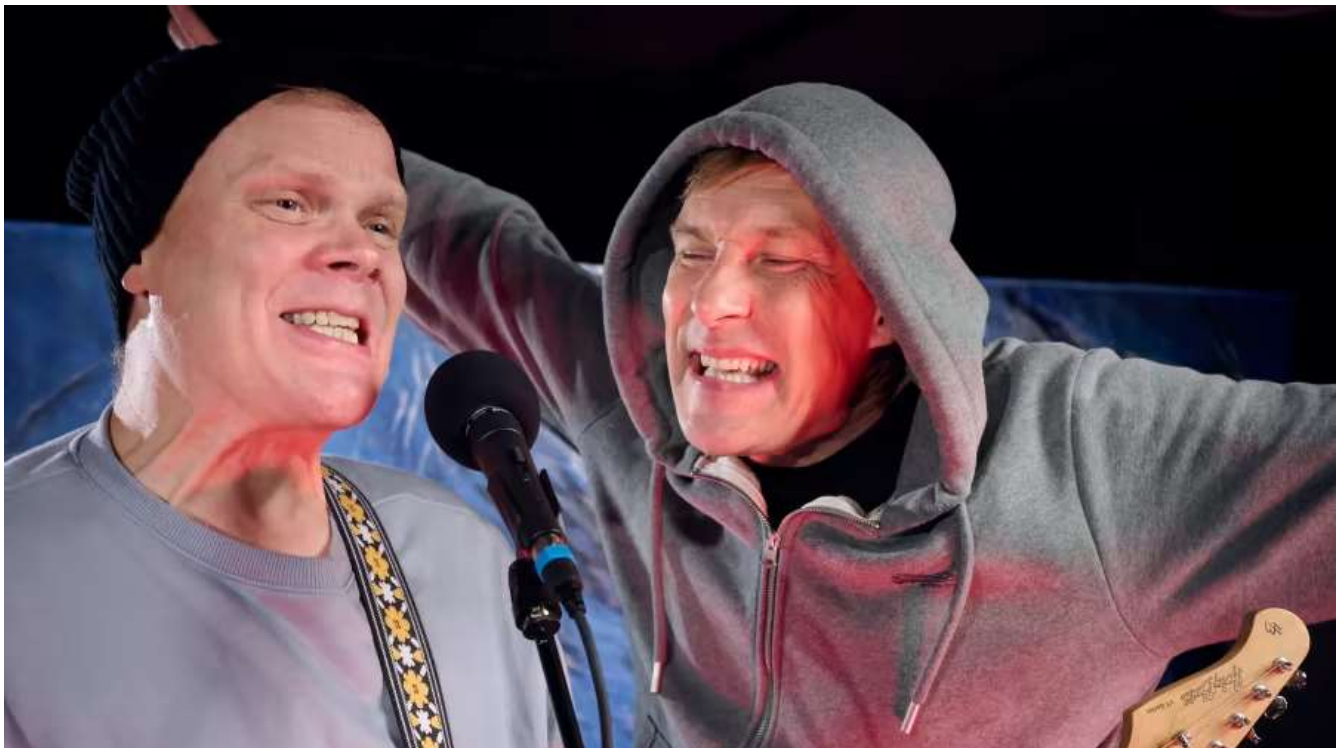
Tonårskillarna Jimi och Ali har sina drömmar som ger dem kraft att streta på genom den frustrerande vardagen.

Men hur kommer det gå för killarna? Frågan sysselsätter både publiken och de två skådespelarna som ibland stiger ur rollerna för att debattera fortsättningen.